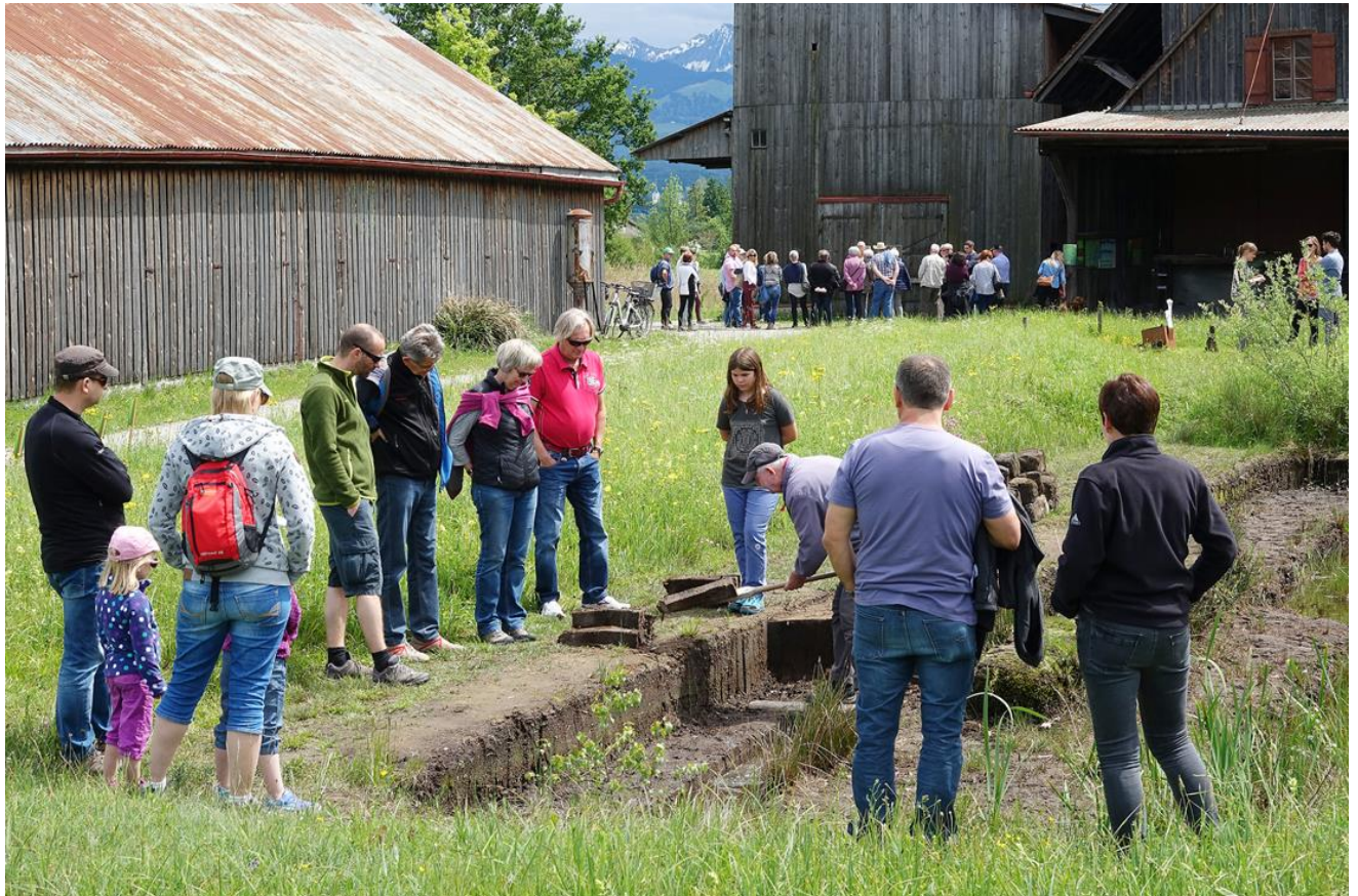
Abb. 1: Im Naturzentrum Schollenmühle SG wurde ein „Torfwürfel“ eröffnet Fig. 1 : Dans le centre nature Schollenmühle SG, un "cube de tourbe" a été inaugurée.