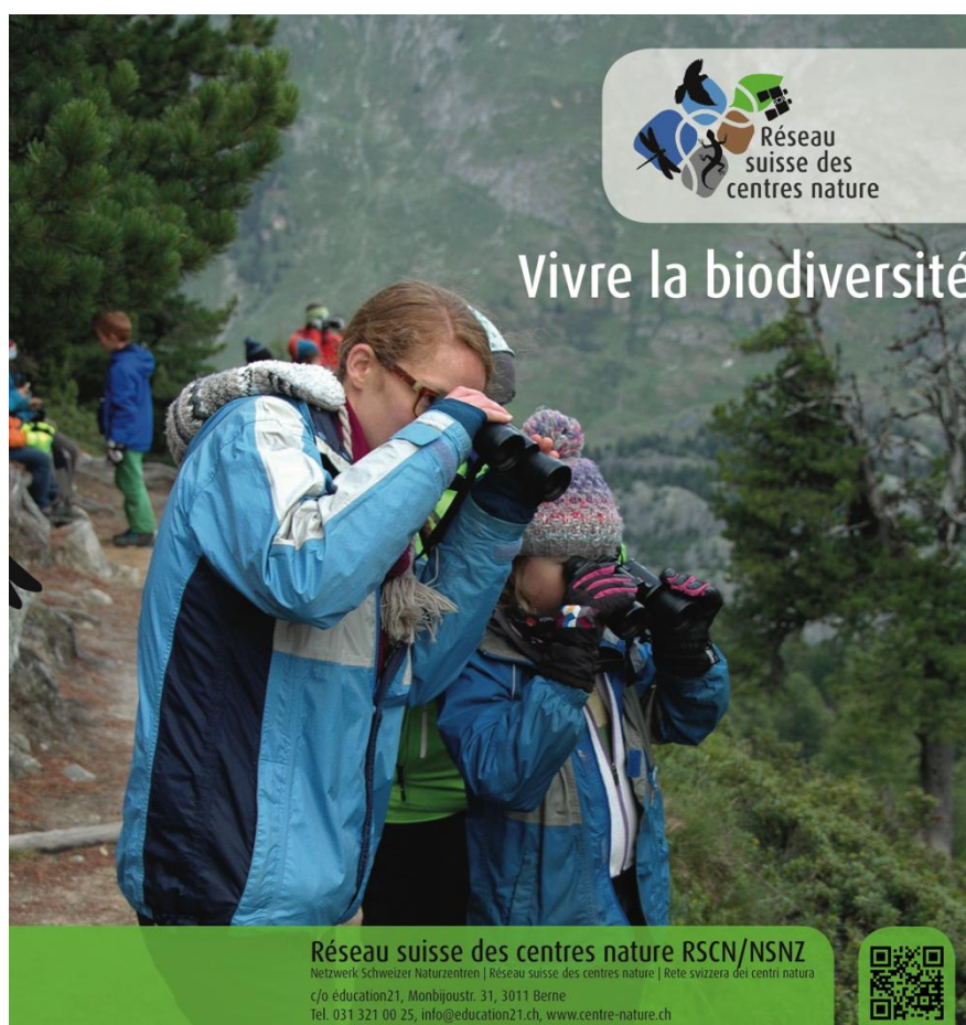
Fig. 4 : Le flyer 2018 de présentation des centres nature suisse membre du RSCN

Abb 4: Der Flyer 2018 des NSNZ über die Naturzentren der Schweiz.