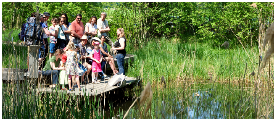
Fig. 5. La journée porte ouverte dans le Naturzentrum Thurauen. Tag der offenen Tür im Naturzentrum Thurauen.