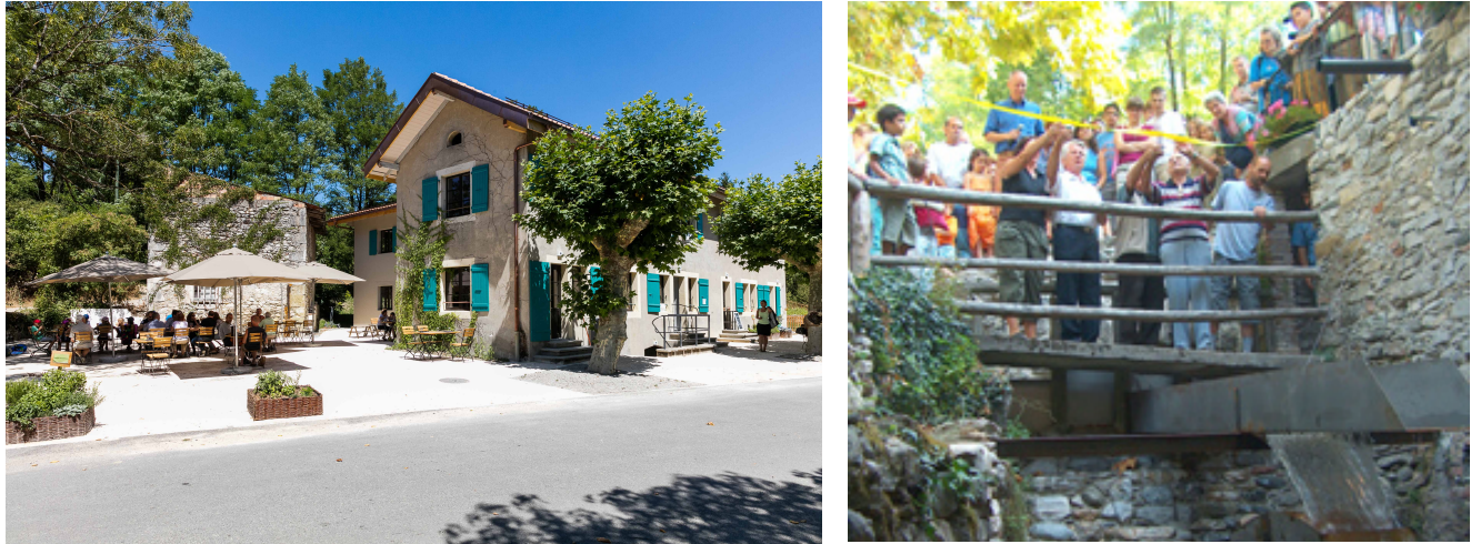
Fig. 4. Les deux nouveaux membres du RSCN: Le centre Pro Natura de l'Allondon GE (à gauche) et Gole della Breggia (TI). Die zwei neuen Mitglieder des NSNZ: Das Pro Natura Zentrum Allondon GE und Gole della Breggia TI.