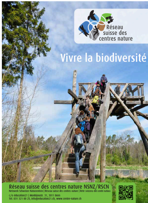
Abbildung 2: Der neue Flyer für die Naturzentren und das NSNZ. Le nouveau flyer des centres nature et du RSCN.