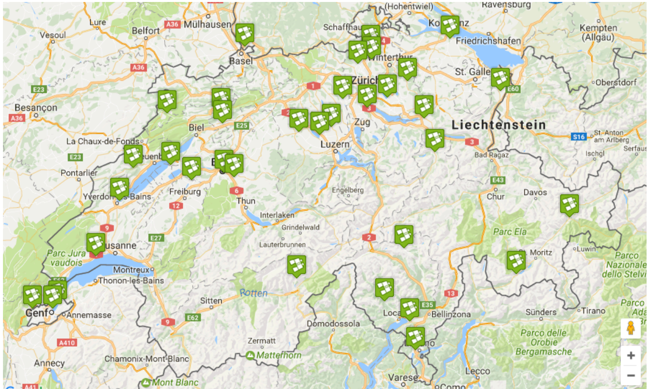
Abbildung 1: Die Naturzentren der Schweiz, die Mitglieder des NSNZ sind. Les centres nature qui sont membres du RSCN.